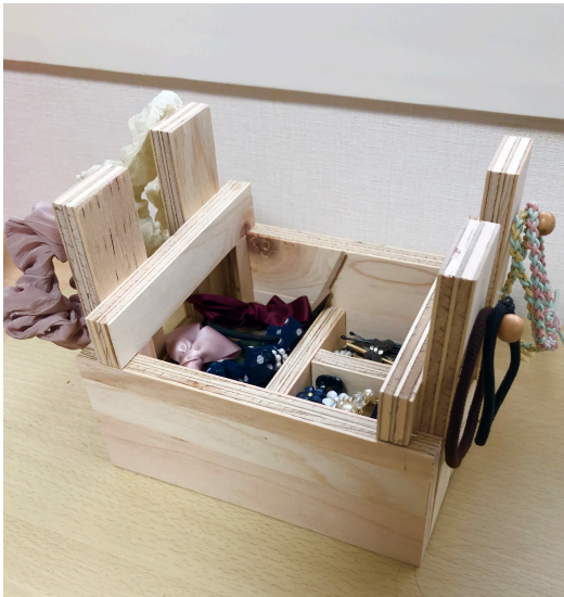
製品を使っている様子