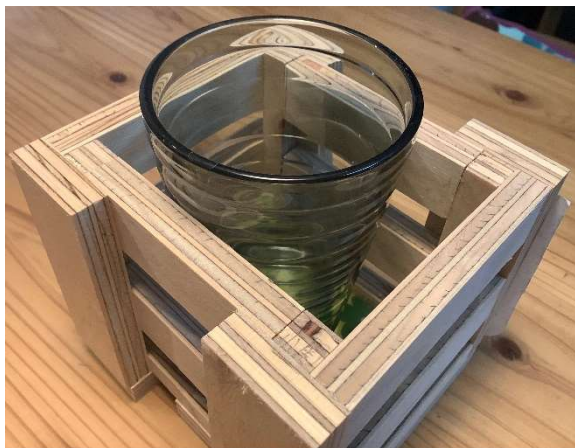
使っているときの様子